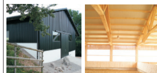
Reithallen - Mehrzweckhallen