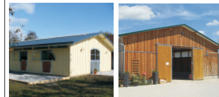
Pferdestallungen - Außenboxen